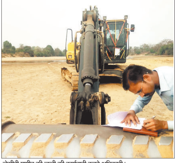
जेसीबी मशीन की जब्त की कार्यवाही करते अधिकारी।