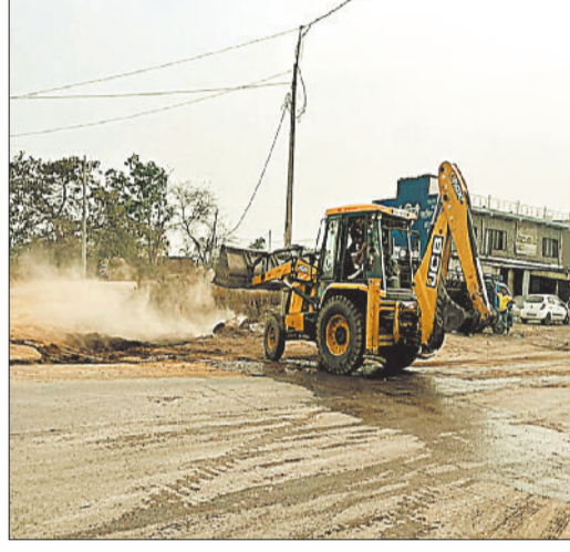
जेसीबी की मदद से अतिक्रमण हटाने की कार्रवाई करता अमला।