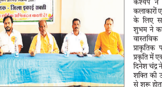
कार्यक्रम में मंचस्थ अतिथिगण।

प्रथम सत्र कार्यक्रम में स.श. म.बिर्वा से कीर्तन के साथ प्रभापेरी निकाली गई, जिसमें संस्कार भारती के पदाधिकारी गण शामिल हुए। मुख्य वक्ता के रूप में भागवताचार्य